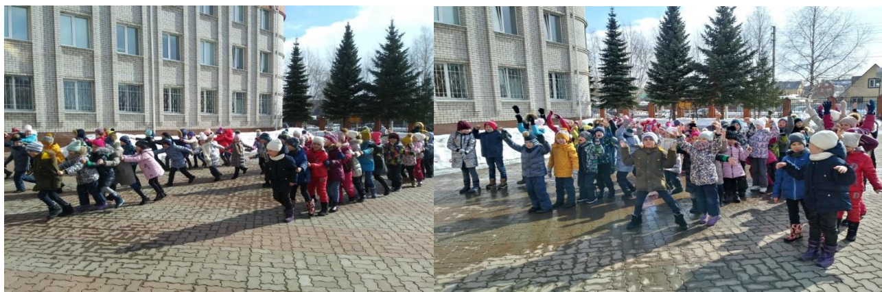
Эстафета «Все ради здоровья» среди 1-2 классов